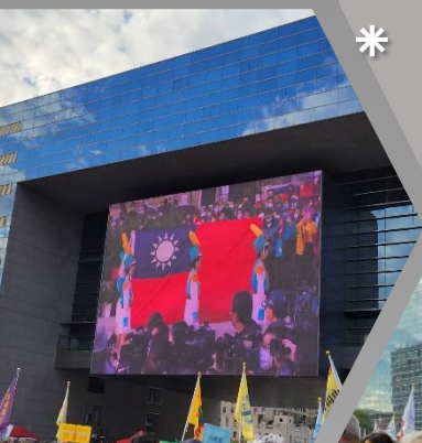
元旦升旗典禮 國旗飄揚